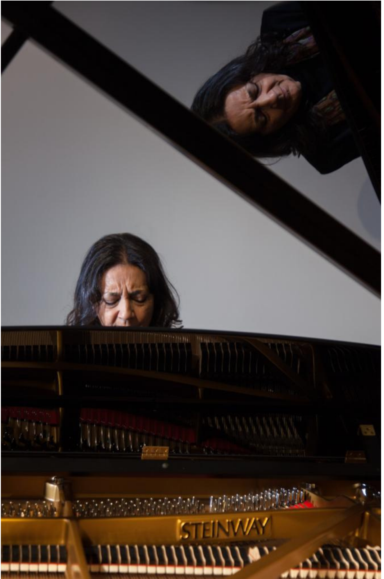
©Margarida Gual - Piano Steinway & Sons - Cortesía de Jorquera Pianos