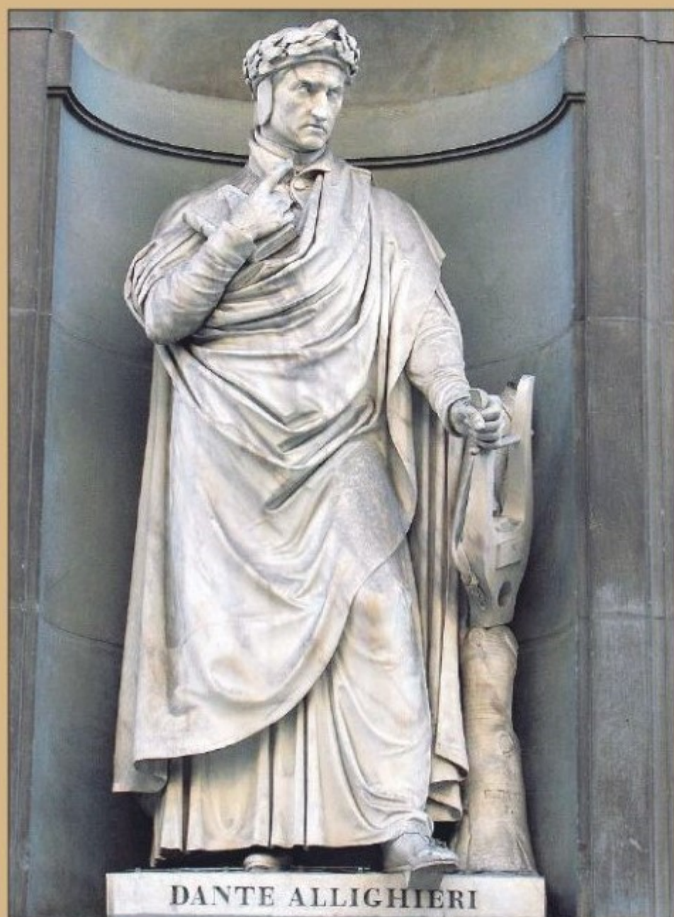
Estatua de Dante Alighieri en la Galería Uffizi de Florencia.