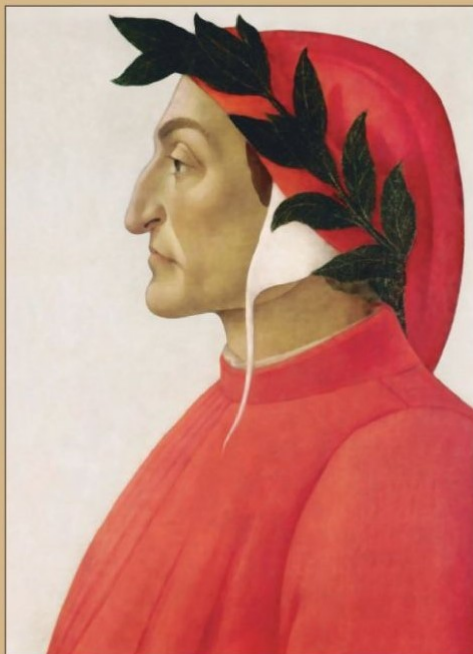
Retrato de Dante (hacia 1495), por Sandro Botticelli (Colección particular, Ginebra).

Alfredo Canelo, en su libro La Divina Comedia en ideas musicales (2009), cita la carta que Liszt escribe a su amigo Pierre Wolf comentándole que "la poesía didáctica y alegóricamente religiosa de Dante está a mi alrededor, tiende a impregnarme más y más de idealidades. La estudio, la medito, la devoro con furor, al punto que me ha permitido escribir música religiosa desde la perspectiva del ilustre florentino".